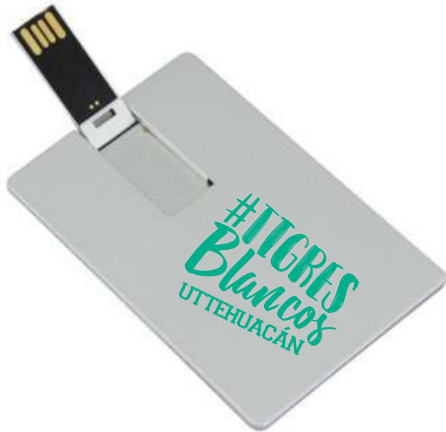
MEMORIA USB 8GB $150.00