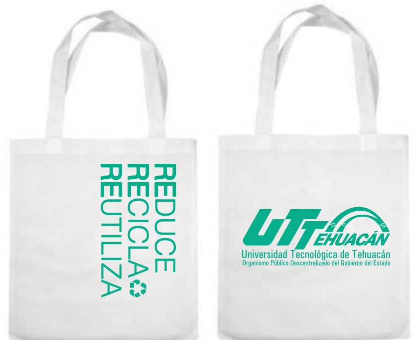
BOLSA ECOLÓGICA $17.00