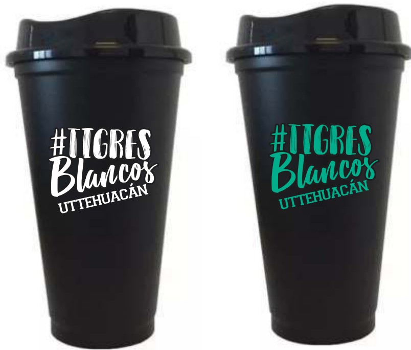
VASO TRICH $35.00